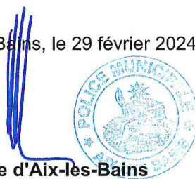
Le Maire d'Aix-les-Bains Renaud BERETTI